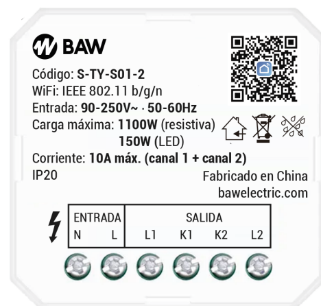
Diagrama de conexionado